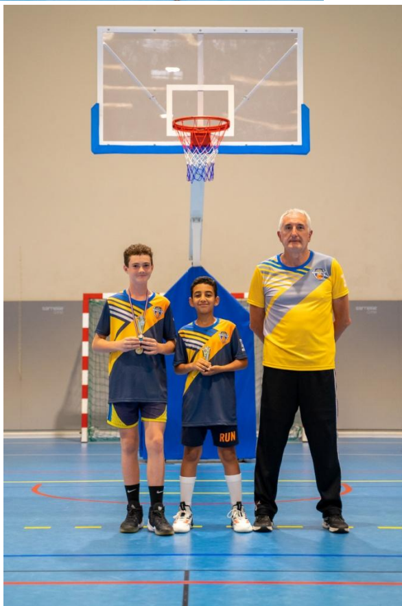
VAINQUEURS 3 X 3