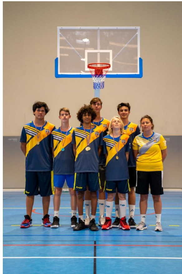
VAINQUEURS 5 X 5