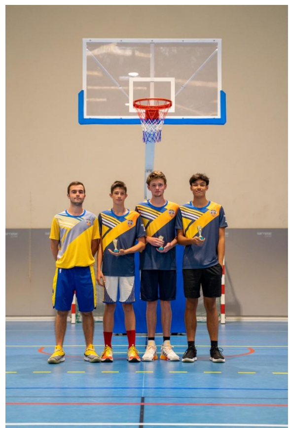
VAINQUEURS 5 X 5