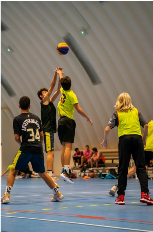
Tournoi 5c5 et 3x3