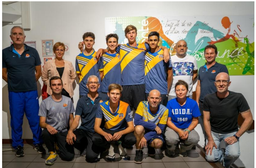
Repas avec le comité directeur