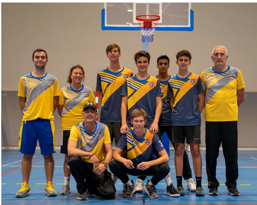
5 JOUEURS ONT EFFECTUES LES 5 CAMPS DU CLUB