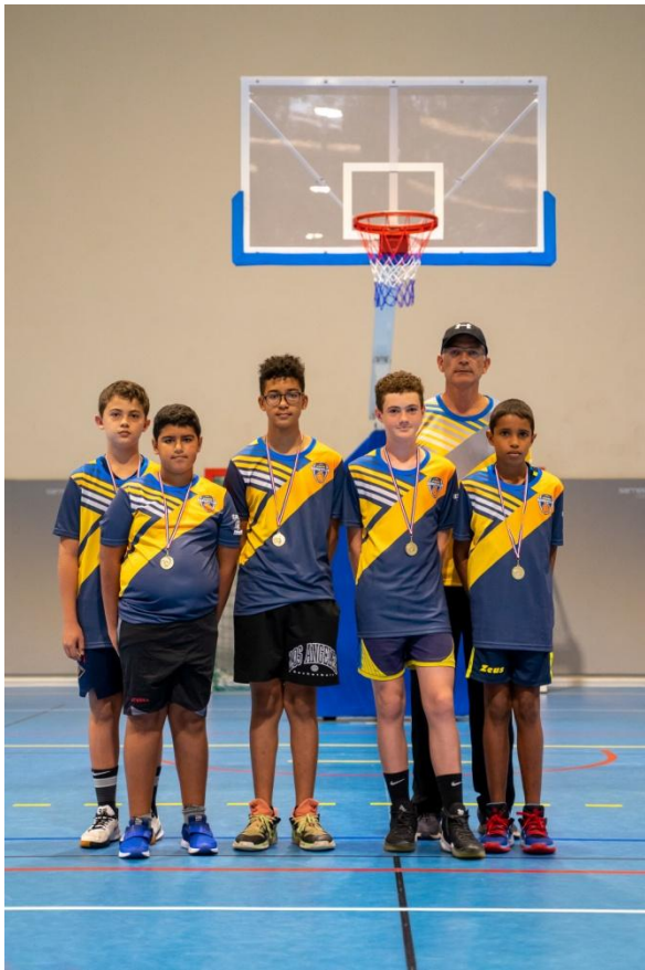
VAINQUEURS 3 X 3