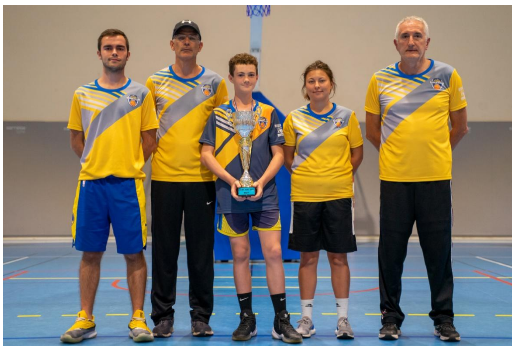
MEILLEUR JOUEUR DU CAMP